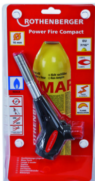
Power Fire Compact Nr 3.5424