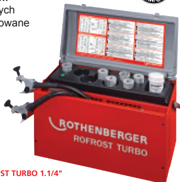
ROFROST TURBO 1.1/4" Nr 6.2200