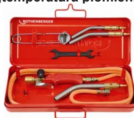
Zestaw TURBOPROP Nr 3.1094

Wysokowydajny palnik na propan do lutowania twardego, temperatura płomienia 2200° C