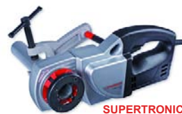
SUPERTRONIC 1250 Nr 7.1450

Gwintownice elektryczne do 1.1/4" ( SUPERTRONIC 1250 ) lub do 2" ( SUPERTRONIC 2000 ) przeznaczone są do szybkiego i łatwego wykonywania precyzyjnych, zgodnych z normami i pewnych gwintów