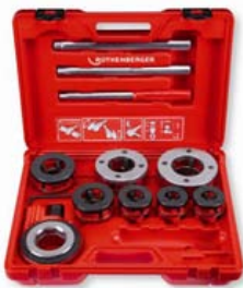
SUPER CUT 2 Nr 7.0892X

Zestaw SUPER CUT 2" (Nr 7.0892X) zawiera: gwintownicę z grzechotką 2", adapter, szybkowymienne głowice gwintarskie od 1/2" - 2" skompletowane w walizce z tworzywa sztucznego.