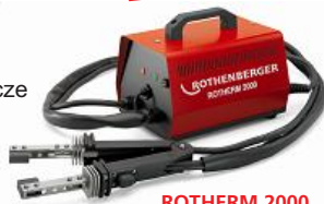
ROTHERM 2000 Nr 3.6702