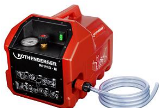
Pompa RP Pro III Nr 6.1185

Przeznaczona do prób ciśnieniowych rurociągów i zbiorników w instalacjach sanitarnych i grzewczych.