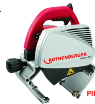
PIPECUT 200U Nr 5.6713