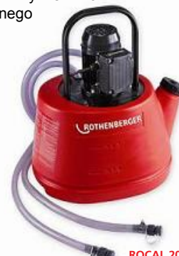
ROCAL 20 Nr 6.1100

Środki odwapniające ROCAL Działający antykorozyjnie środek ROCAL szybko i efektywnie oczyszcza układy. Zwiększa żywotność pompy. Nie powoduje pienienia się. Rozcieńczenie w stężeniu 10- 30 % z wodą.