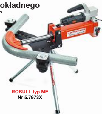
ROBULL typ ME Nr 5.7973X