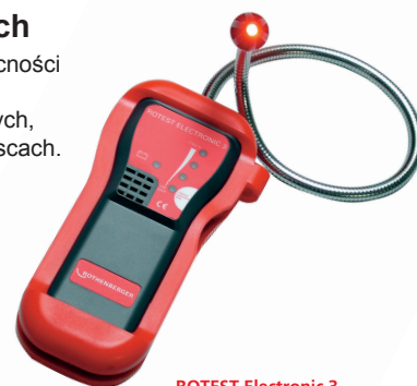
ROTEST Electronic 3 Nr 6.6080

Przeznaczony do wykrywania obecności gazu w pomieszczeniach oraz nieszczelności przewodów gazowych, również w trudno dostępnych miejscach.