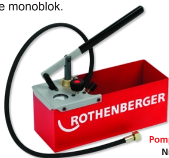
Pompa TP 25 Nr 6.0250