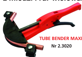
TUBE BENDER MAXI Nr 2.3020

Jednoręczna giętarka do precyzyjnego gięcia rur z miedzi i rur wielowarstwowych do 90°, Ø 12 - 22 mm