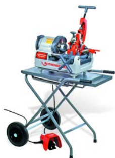
ROPOWER 50R Nr 5.6050

* Do każdej zakupionej gwintownicy klucz 2" (7.0124X) w cenie 1 PLN netto !!!