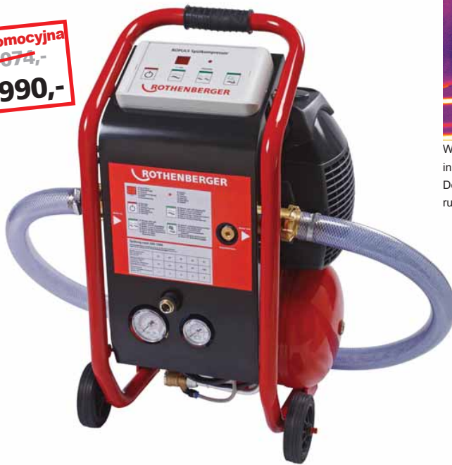
ROPULS Sprężarka do płukania instalacji Nr 6.0110