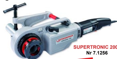
SUPERTRONIC 2000 Nr 7.1256