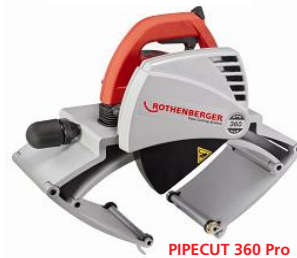
PIPECUT 360 Pro Nr 5.6712