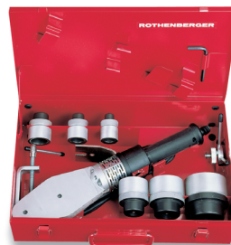
ROWELD P 63 - 3 Nr 5.3545

Lekka zgrzewarka kielichowa do pracy z mufami grzewczymi Ø 20 - 63 mm z możliwością jednoczesnego użycia dwóch kombinacji zgrzewania mufek, rur i kształtek o średnicach do Ø 63 mm. Komplet z regulacją elektroniczną temperatury, kontrolą sieci, automatycznym zabezpieczeniem przed przegrzaniem, kompletna z trzpieniami grzewczymi i tulejkami grzewczymi (Ø20 - 63), kluczem imbusowym SW 6, śrubami mocującymi, stołowym zaciskiem mocującym i stojakiem podłogowym. Całość skompletowana w stalowej skrzynce narzędziowej.