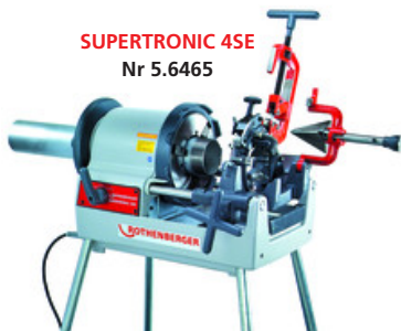
SUPERTRONIC 4SE Nr 5.6465