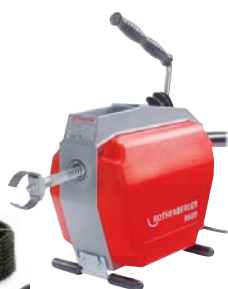
R 600 z wyposażeniem Nr 1.9173

Zestaw (nr 1.9173) zawiera: R 600, wąż prowadzący + zestaw zawierający: kosz na spirale 16 mm, 5 spiral Standard 16 mm, wiertło proste 16 mm, wiertło maczugowe 16 mm, wiertło płaskie 16/25 mm, klucz rozdzielczy 16 mm, kosz na spirale 22 mm, 5 spiral Standard 22 mm, wiertło proste 22 mm, wiertło maczugowe 22 mm, wiertło łyżkowe 22/65 mm, klucz rozdzielczy 22mm, rękawicę prowadzącą z nitami lewą, płyn do spiral ROWANOL w sprayu, walizkę z PVC.