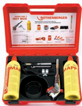
SUPER FIRE 3 HOT BOX Nr 3.5490-C

Zestaw (nr 3.5490) składa się z : uchwytu palnika (nr 3.5445), palnika cyklonowego (nr 3.5457), palnika precyzyjnego (nr 3.5455), odbijacza płomienia (nr 3.1043), podstawki (nr 3.5461), 2 szt. pojemników z gazem MAPP® (nr 3.5551-C).